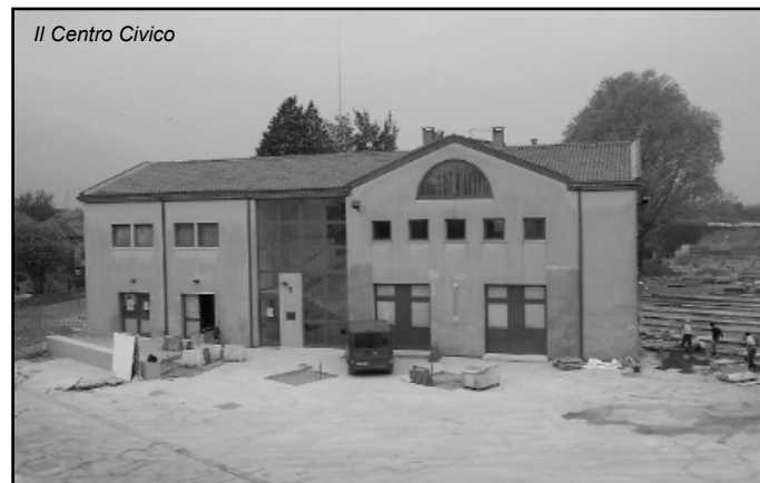
Il Centro Civico

E' stato modificato il Regolamento per la concessione degli impianti sportivi comunali. Il Comune ha aderito alla Dichiarazione sull'etica nello sport giovanile", presentato al mondo sportivo internazionale da PANATHLON INTERNATIONAL, ed ispirato, tra l'altro, alla Carta dei diritti dei ragazzi nello sport . Con la modifica approvata è stato inserito l'obbligo per tutte le associazioni sportive che vorranno usufruire degli impianti sportivi comunali, di aderire a questo Documento impegnandosi così a favorire il rispetto delle regole di condotta e fair-play nella pratica sportiva. Per informazioni rivolgersi all'ufficio Segreteria chiamando il n. 0421/324440 (interno 1).