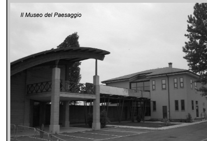
Il Museo del Paesaggio

- l'assegnazione di 68 opere da parte della Fondazione della Cassa di Risparmio di Venezia destinate ad arricchire la mostra permanente del Museo del Paesaggio (delibera n. 22 del 12 febbraio). Si tratta del frutto della collaborazione iniziata nel 2007 con questa importante Istituzione che ha visto in Torre di Mosto ed in particolare in quello che era l'edificio della ex scuola elementare di Boccafossa, ora riattato a struttura museale con un interessantissimo intervento di ristrutturazione interna, un punto di sviluppo per un percorso culturale da avviare e potenziare. La rilevanza del partner, le sue credenziali ed il programma 2009 fanno ritenere fondate le intenzioni di creare a Boccafossa un polo culturale di notevole richiamo.